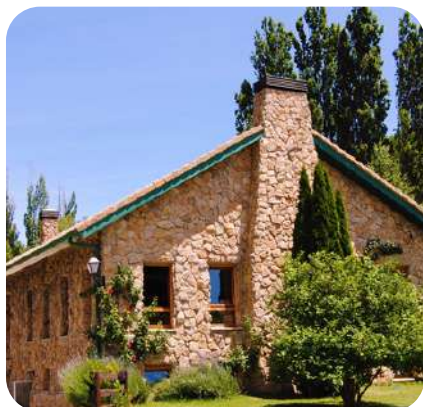
• Albergue principal